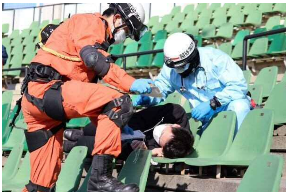
令和3年度埼玉県特別機動援助隊合同訓練を 越谷市民球場で実施しました。

また、それぞれの機関の災害出動及び活動等については、活動規定の重複や煩雑化を避けるため、消防機関については埼玉県下相互応援協定の規定、防災航空隊については埼玉県条例の規定、医療機関については埼玉 DMAT 設置運営要綱の規定を準用することとしました。