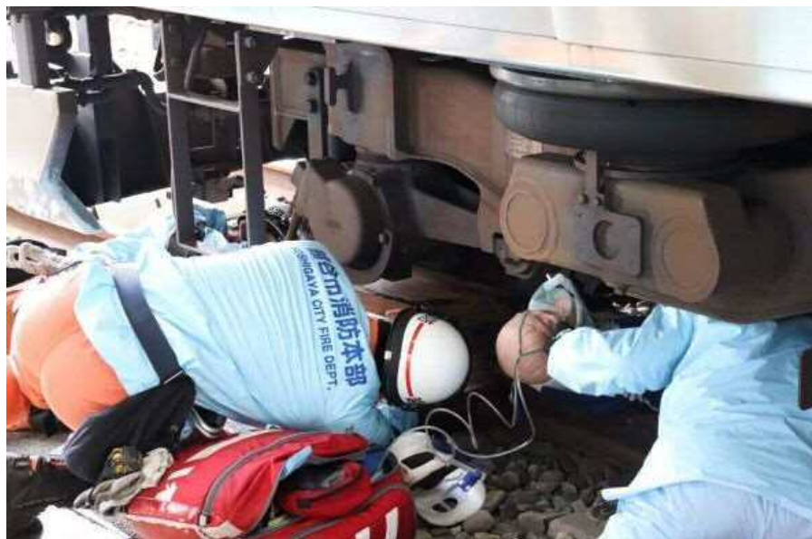
令和3年10月26日(火) 浦和地区人身事故早期復旧訓練を東日本旅客鉄道株式会社 さいたま車両センターで実施しました。