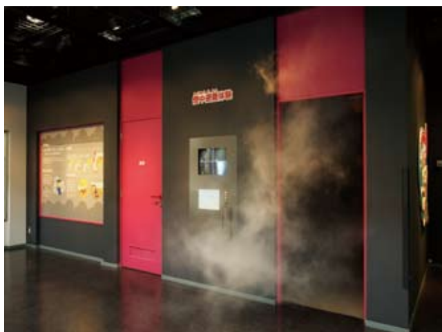
煙中避難体験施設