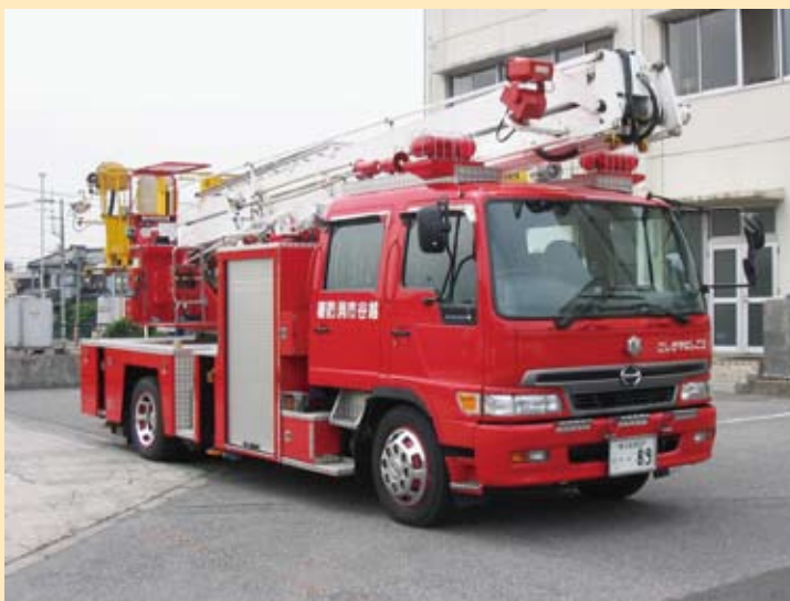
15m級屈折はしご付消防ポンプ自動車