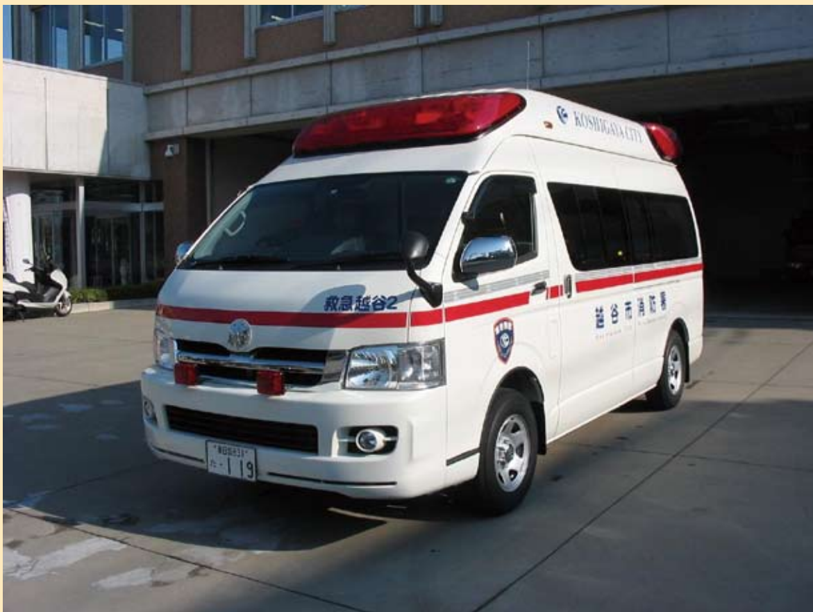
高規格救急自動車