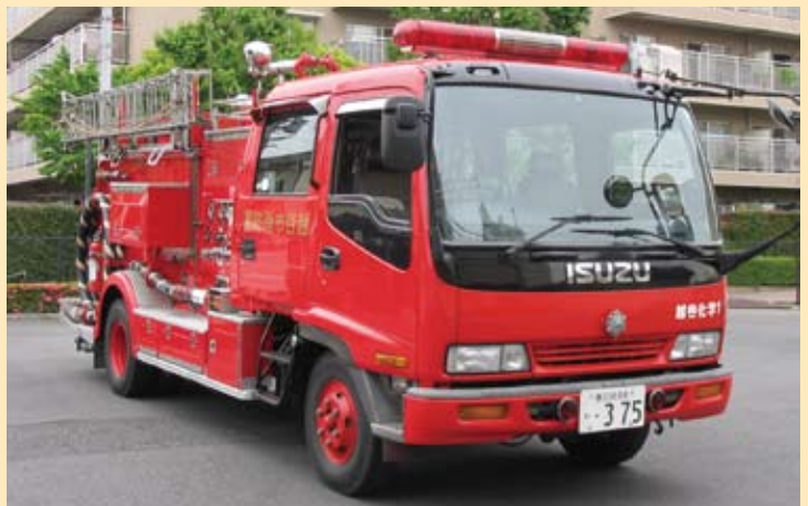
化学消防ポンプ自動車