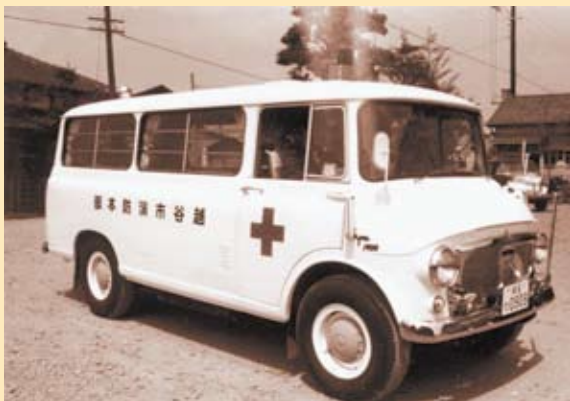
昭和37年配置（運用開始時の初代救急車）