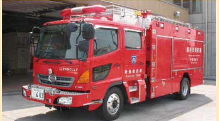
消防ポンプ付救助工作車Ⅱ型