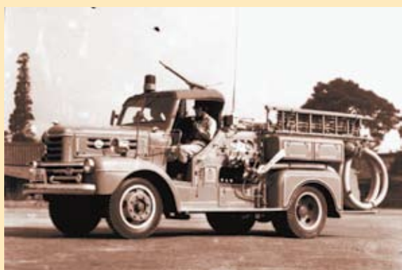
昭和34年開署時に配置