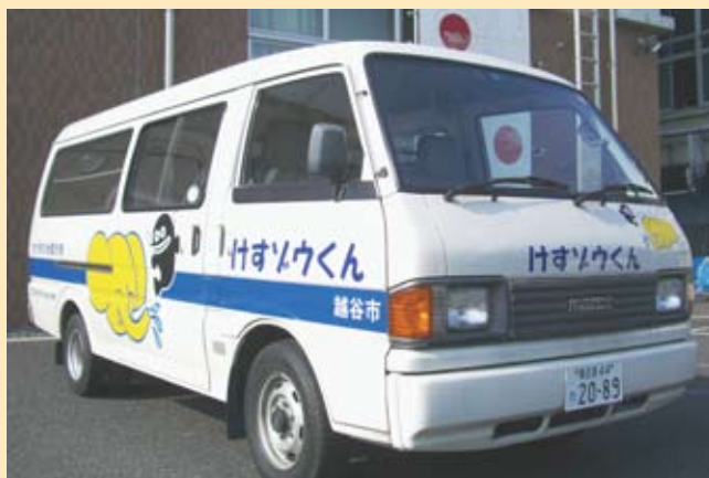
消火通報訓練指導車