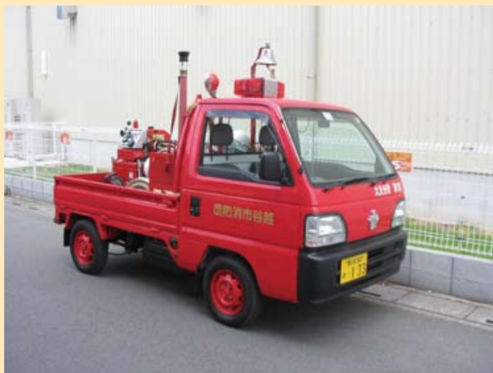
小型動力ポンプ搬送車