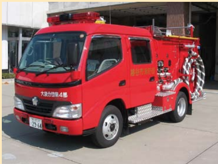
消防団消防ポンプ自動車