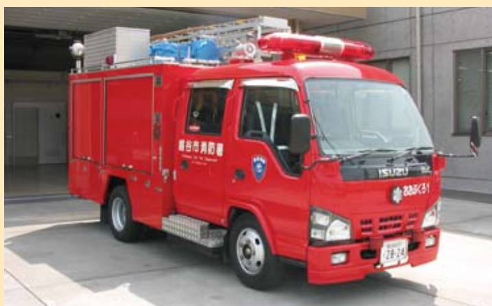
消防ポンプ自動車水槽付