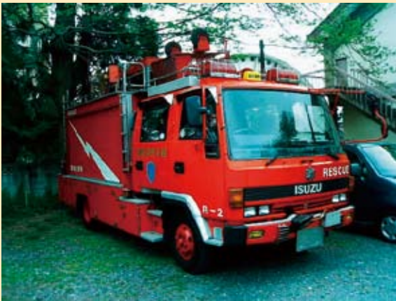
平成2年配置（初代救助工作車Ⅱ型）