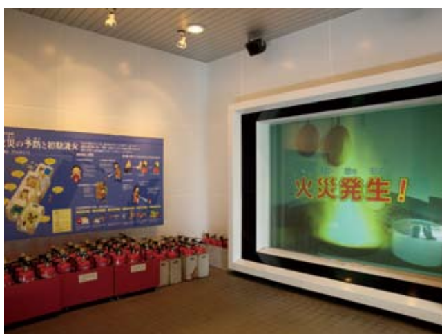
初期消火体験施設