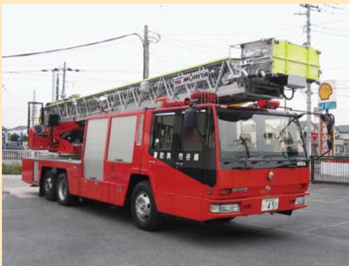
38m級はしご付消防自動車