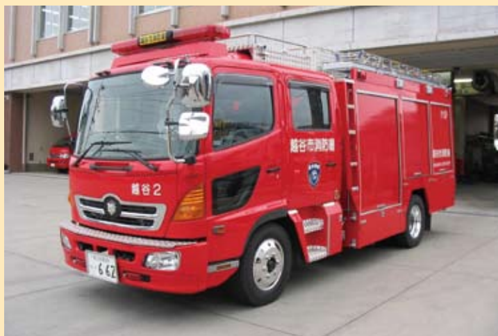
水槽付消防ポンプ自動車