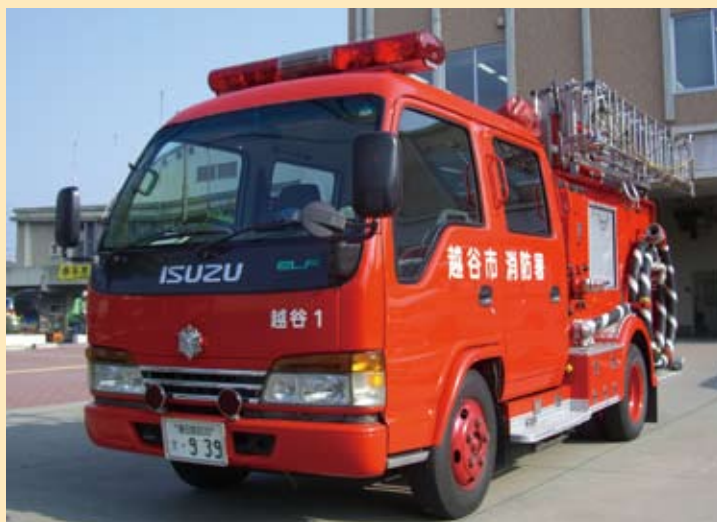
消防ポンプ自動車