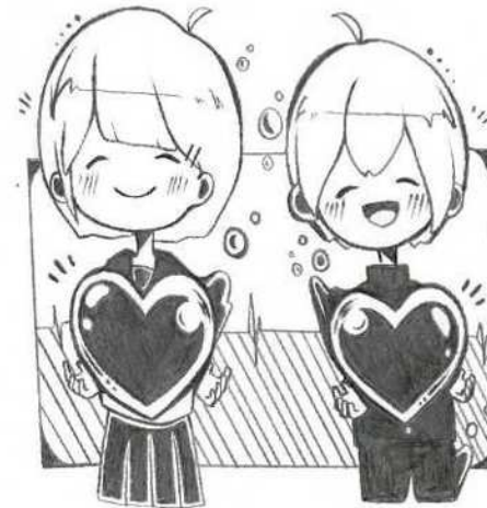
イラスト：「おあしす」R2 卒業生作品