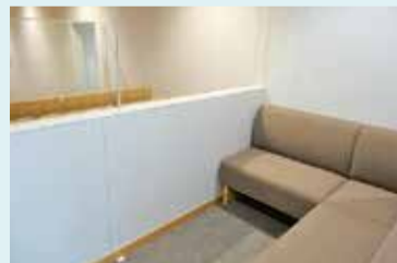
親子傍聴席は外に音が漏れない構造になっています