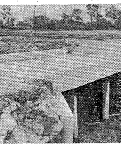
荻島支所管内(南荻島地内橋梁工事費、一〇五、〇〇〇円で完了)