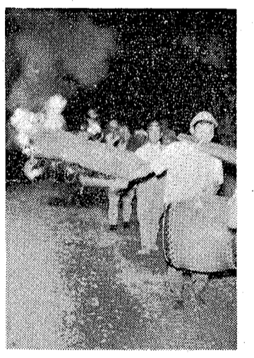
大袋保育所開所準備の様子

大袋保育所は、来る十月一日に開所することになりました。福祉事務所で、市民委員さんをお呼びして、入所希望者の調査をしてもらいました。次の要領で入所申請の受付が始まりました。