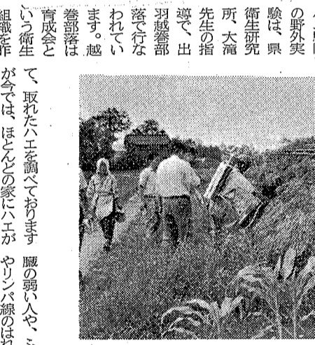
ハエの野外駆除実験をする越後部落の人たち

ハエを撲滅するには第一に、ハエの発生する源を除去しなければならぬ。このためには、糞、尿、食べ残し、