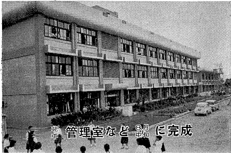
8月中旬 管理室などに完成

市民税...第2期 国民健康保険税...第5期 中川・緑瀬・元荒川各期 土地改良区費...全期