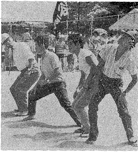
市民体育祭ひらく

毎年九月十五日現在で、つくりかえられた選挙人名簿の資格調査が、去る九月十日から始まりました。この調査は、選挙権のある者を調査して、これからの選挙に使用される。調査は、選挙権のある者を調査して、これからの選挙に使用される。