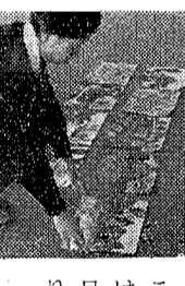
銃砲刀剣の取締り