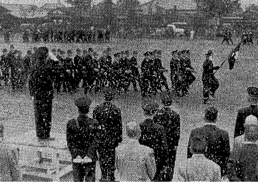
消防団査閲式行なう 自動ポンプ二台による放水試験

工業用水道 草加市、越谷市、八汐町の工業用水道が、十一月十日から給水されます。この水道は、越谷市立体育館敷地内に建設された浄水場から引き込まれます。