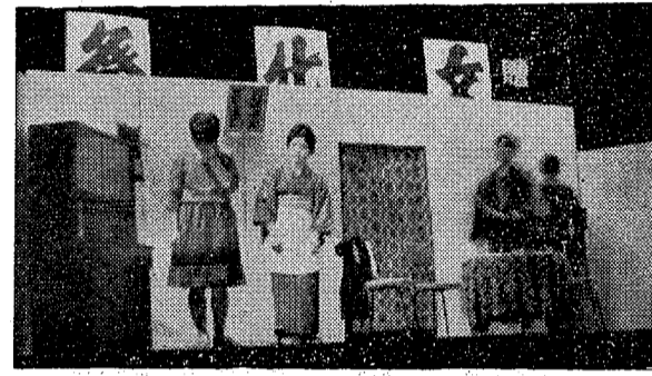
文化祭ひらく一越ヶ谷公民館で 越ヶ谷公民館では、去る11日越ヶ谷小学校で文化祭を催しました。