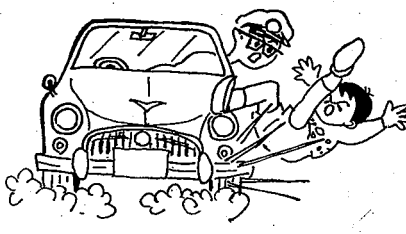
あぶない！ふいのとびだし。

九月十五日現在で保険金の支払いは、事故件数が八十八件で百七十万三千円となつています。