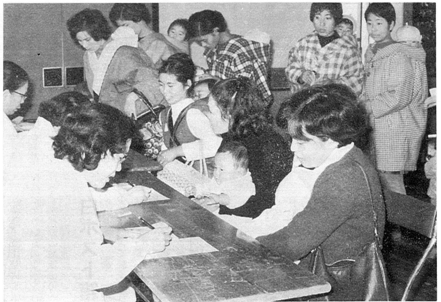
年4回行なう乳幼児健康相談(市立体育館で)

保健婦は、右にあげた検診のほか、結核検診、妊婦検診、乳児検診、三歳児検診、老人健康診査など多方面にわたって活動しています。