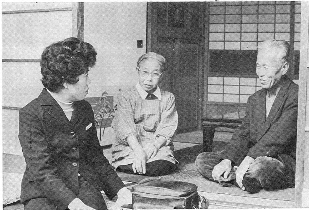
おじいちゃん、おばあちゃん、お元気ですか——えん側で話しかける保健婦

あなたは、保健婦をご存知ですか？、保健婦は、市民の皆さんの健康を守るにない手として重要な役割をはたし、皆さんのよき相談相手となつて、健康の保持増進、病気の予防、病気の早期発見、医療の相談から、リハビリテーション（社会復帰）まで、広い範囲の活動をして、大きな成果をあげています。今回は、越谷市の保健婦の活動について皆さんにご紹介します。