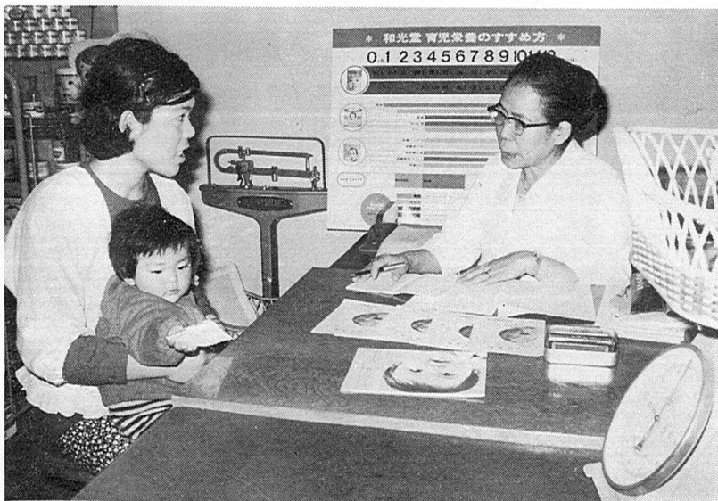
健康相談は、毎週月曜日と木曜日です

毎週月曜日と木曜日の午前九時から四時まで健康に関する相談を受けています。だれでも相談できますから、ご希望の方は、どしど