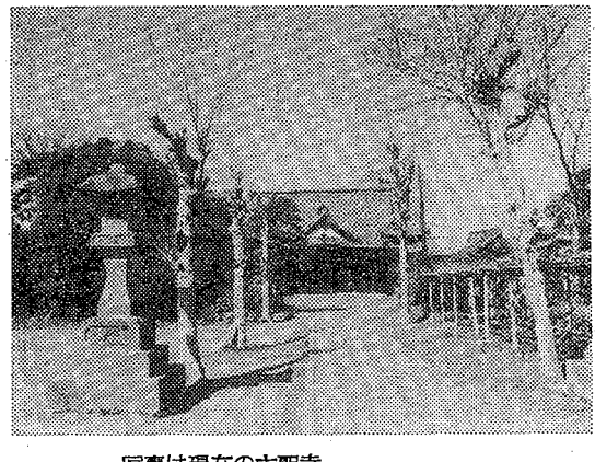
写真は現在の大聖寺

年末の保健所業務。▽いらぬ犬の引取り。12月26日(水)まで。午前9時～午後5時。▽水質検査。12月17日(日)まで。午前9時～11時。▽便の検査。12月20日(水)まで。午前9時～11時。▽その他の試験と検査。12月20日(水)まで。午前9時～11時。問合せ 越谷保健所 ☎64-11266