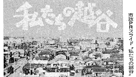
市政PRスライド「私たちの越谷」

越谷市の歴史や文化財・民芸品、市役所の仕事などをわかりやすく紹介した市政PRスライド「私たちの越谷」が完成しました。語りは小学生を対象としていますが、各自治会・子ども会・各種団体の集会など幅広く利用できますのでぜひ一度ご覧ください。 貸出し 2月2日(月)から、専用映写機ごと貸出します。 申込み 広報課広聴係 内線321 <内容>①越谷市の歴史②市役所のしくみと働き(出生から老後まで、学校のできるまで、日常生活)③文化財・民芸品④市民憲章 *エクスカラ-111コマ、25分45秒