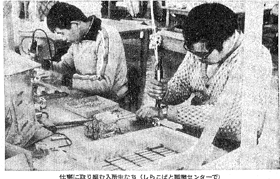
仕事に取り組み入所生たち(しらこぼと職業センターで)

今年も国際障害者年の暮あけです。今年も国際障害者年の意味と越谷市での福祉施策のうち、障害者年への3つの施設を紹介いたします。国際障害者年を契機として、すべての人が社会生活に参加し、平等に暮らせるよう、よりよい社会づくりについでみようと、こしがや市は考えてまいります。