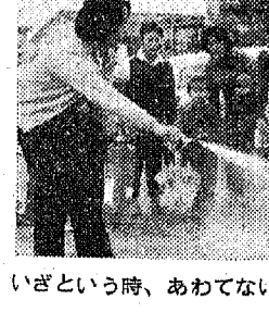
防火教室に参加しよう

火災は、私たちの生活に大きな被害をもたらします。火災を防ぐためには、火災予防の知識と対策が必要です。火災は、私たちの生活に大きな被害をもたらします。火災を防ぐためには、火災予防の知識と対策が必要です。