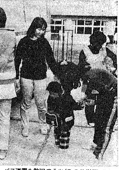
バス通園も勉強のうち(みのり学園で)

今年も国際障害者年の暮あけです。今年も国際障害者年の意味と越谷市での福祉施策のうち、障害者年への3つの施設を紹介いたします。国際障害者年を契機として、すべての人が社会生活に参加し、平等に暮らせるよう、よりよい社会づくりについでみようと、こしがや市は考えてまいります。