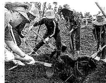
植樹少年自然の家(泊) 翌日、ふれあいの森散策、あたら山ハイキング(午後6時ごろ市役所着)

▽植樹会場 福島県双葉郡浪江町国有林野 ▽参加費 小・中学生2000円、高校生以上3000円 ▽日程 第1・2回 午前7時30分市役所西口玄関前集合・出発 第3回 午後1時市役所西口玄関前集合・出発