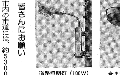
道路照明灯 (100W) 今までの防犯灯

夜間、通行する道路には、照明灯が全て設置されることが理想ですが、現状では困難です。次にあげる場合に該当するときは、設置できません。 ①コの字型道路で、その自治会の方が主に利用する場合 ②設置要望個所の道路幅員が狭く、車両等の通行を妨害することが明らかなき ③設置要望個所の電柱に、トランス(変圧器)が載っているとき ④同一の市道上で、設置要望個所と既設の防犯灯(道路照明灯を含む)との距離が1000