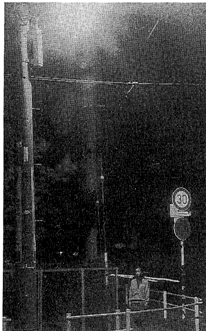
道路照明灯 (100W) 今までの防犯灯

平成3年度の設置からは、防犯灯を廃止し、明るい道路照明灯を設置することになりました。このため、平成3年度予算を2000万円に増額し、3000基の道路照明灯を設置する予定です。 また、今回、道路照明灯に一本化されたことにより、その維持・管理は市が行います。当然電気料金も市の負担です。 なお、過去に市が設置した防犯灯の維持・管理は、自治会に引き継ぎお願いしていますが、電気料金は市の負担で、今まで