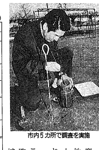
市内5カ所で調査を実施

環境汚染の状況は、平成8年度の調査で、大気中のダイオキシン類は、大都市域において1立方メートルあたり0.3〜1.0pg-TEQ/g程度であった。また、必要に応じて今年度もダイオキシン類の調査を実施する予定です。