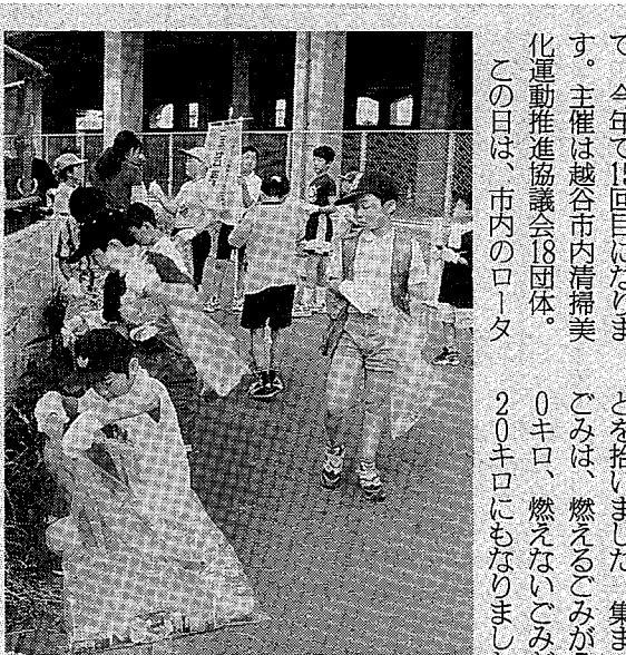
多くの方の協力でたくさんのごみが集まりました

5月31日、市内7駅周辺で越谷市内清掃美化運動が行われました。これは、5月30日のごみゼロの日になんで毎年行っているもので、今年で15回目になります。主催は越谷市内清掃美化運動推進協議会18団体。この日は、市内のロータリークラブ、ライオンズクラブ、ボイススクアウト、ガールスカウトなどの団体約1200人が参加。各駅に分かれて紙くずや空き缶などを拾いました。集まったごみは、燃えるごみが730キロ、燃えないごみが620キロにもなりました。