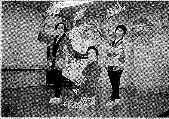
華やかな舞を披露しました

家庭児童 月曜～金曜日(祝日、休日を除く)。午前9時～午後4時。中央市民会館4階相談室。電話可。しつけや習慣、登校拒否、いじめ、非行、家族関係など18歳までの相談を行います。問合せ/児童福祉課児童福祉係