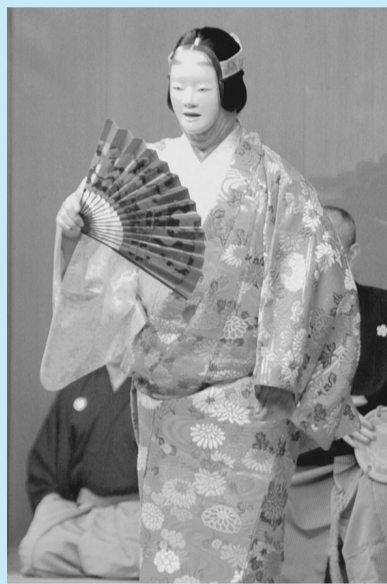
可憐な舞が披露されました

野鳥の森 開園10周年 記念イベントを開催 9月17日・18日の2日間、キャンベルタウン野鳥の森で10周年記念イベントが行われました。同園は、オーストラリアのキャンベルタウン市との姉妹都市提携10周年を記念して平成7年に開園しました。ワラビーやエミュー、オーストラリアの野鳥たちを見ることができま