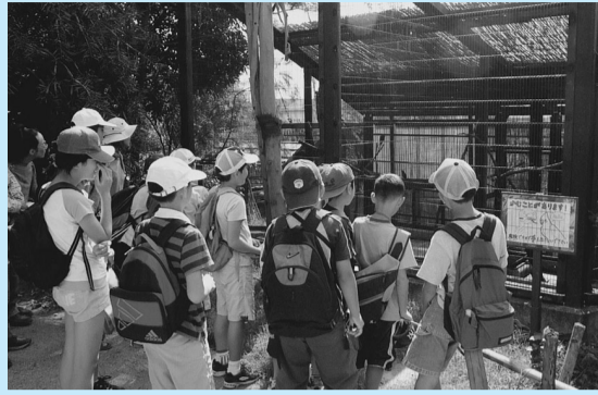
動物園ガイドの様子

開催中は、親子連れなど多くの方が訪れ、小動物ふれあいコーナーやヨーヨー風船釣りなどを楽しまれました。また、動物園ガイドでは飼育員が野鳥の生態などを説明し、参加者は「いろいろな野鳥について知ることができました」など話していました。