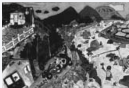
たくさんのトンボが飛び回っている受賞作品

このコンクールは、全国の小・中・高校の児童・生徒がトンボやトンボのいる風景を描くもので、今回は、8万6687点の応募があり、その中からみごと小学4年生の部の環境大臣賞に選ばれました。「自然がいっぱい残っている長野の田舎をイメージして描きました。選ばれたと聞いたときは、とてもびっくりしました」と笑顔で話してくれました。