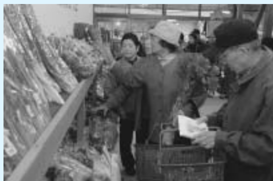
新鮮な農産物が並んでいます

取れた新鮮な農産物が並び、訪れた方は「新鮮な野菜が気軽に手に入るのうれしい」などと話していました。また、コミュニティスペースでは12月22日まで蒲生第二小学校の児童による作品展が開催されています。