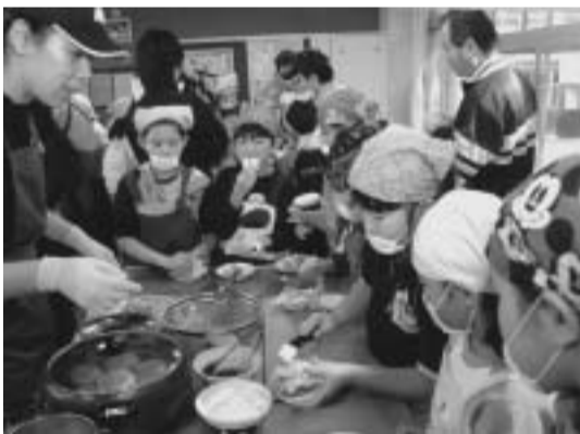
ハンバーガー作りを体験

活を送るために食について学ぶと行われたものです。この日は、(株)モスフードサービスの方を講師にハンバーガー作りを通して手を洗うことの大切さや食べる前に感謝を込めて「いただきます」ということの意味などを学びました。また、調理実習ではパンやハンバーグを教わりながら焼きました。