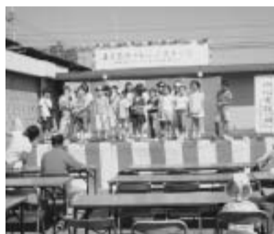
子どもチャレンジステージ

7月、3～6年生でジュニアリーダー講習会をしました。クラフト作りや、ゲーム、みんなでカレーを食べたりしました。私は、みんなと友達になれたゲームが一番楽しかったです。