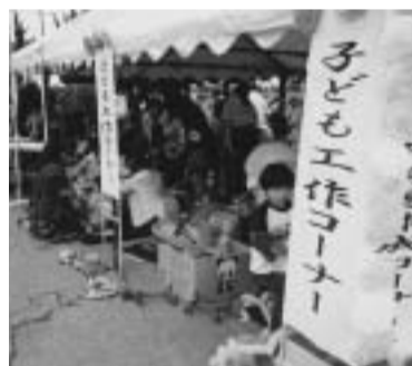
子ども工作コーナー

9月、増林地区の体育祭がありました。子ども会では、リレーや、親子スプリンレース、紅白玉入れと、みんな一生けん命がんばりました。そして、パンくい競走は、菓子パンがもらえるので、みんないっぱい参加しました。10月には、ときめきチャレンジまじばやし地区センターで行われました。今年は、スポーツチャンバラ大会、ときめきステージ、工作コーナーなどいろいろありま