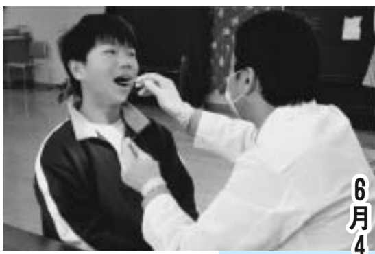
6月4日～10日は歯の衛生週間です