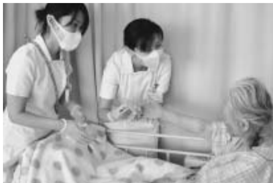
市立病院で行われた「ふれあい看護体験」