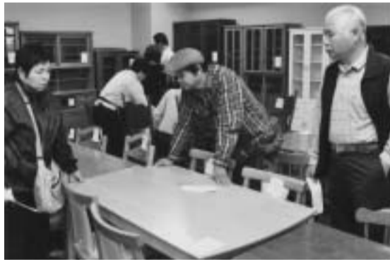
もったいない意識の高揚を図る「リユース展」

リユース展が開催されました。これは、リサイクル品の普及と、市民のごみ減量・資源化に向けたリサイクルの啓発を目的に開催されているもので今回4回目。