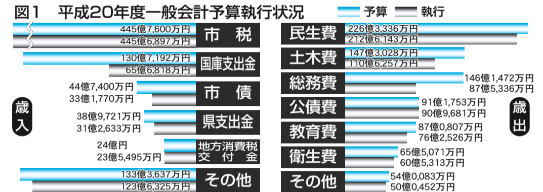
図1 平成20年度一般会計予算執行状況

い者の方などへの福祉サービスや施設整備に要する経費 ▽土木費：道路、河川、公園など都市基盤の整備に要する経費