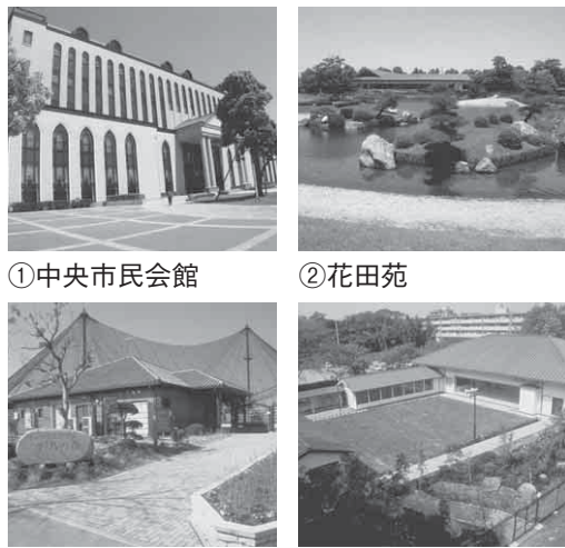
①中央市民会館 ②花田苑 ③野鳥の森 ④弓道場

市では、公共施設の管理・運営について、平成18年度から指定管理者制度を導入しています。指定管理者制度は、民間の能力を活用し、住民サービスの向上や経費の削減を図ることを目的とし、公共団体などに制限されていた