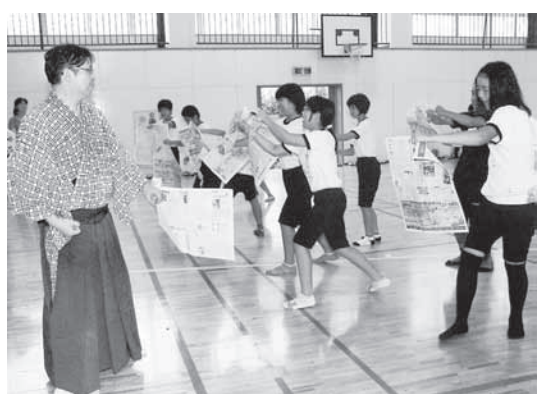
声を出して力を集中。拳で新聞紙に穴が開くかな?

このような取り組みを知り、障害者福祉についていろいろ考えるようになりました。少しでも協力できたらいいと思います。