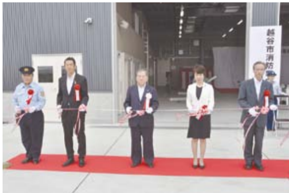
車庫棟の前で行われたテープカット

8月26日、消防署谷中分署(谷中町4の92の1)の開署式が行われました。市西部の消防活動拠点施設となる消防署谷中分署は、9月1日に移転し、供用を開始。広い敷地と、さまざまな災害を想定した消防訓練や救助訓練などが行える訓練施設を新たに設置しました。