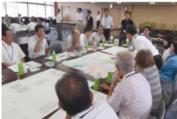
活発な意見が交わされました

現在、市役所本庁舎の建て替えに向けた「新庁舎建設基本設計」に関する市民ワークショップを開催しています。新たな庁舎は「越谷市民の安全・安心な暮らしを支える親しみのある庁舎」をキャッチフレーズに掲げ、市民サービスをはじめ災害発生時の拠点施設としても十分機能する庁舎を目指しています。