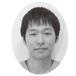
越谷市医師会 こしがや胃腸内科・皮膚科 ☎973-7846 つるた 史