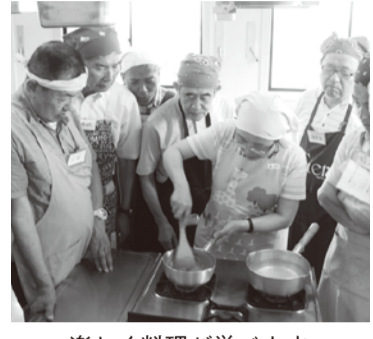
楽しく料理が学べます

◎「秋の味覚を楽しむ料理教室」 時間9月28日(木)、午前10時~午後1時 因講話と調理実習 因24人 費500円 申9月11日(月)から