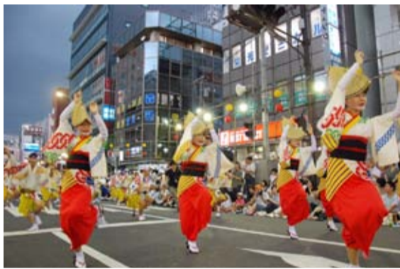
にぎやかな音色と掛け声で舞う

8月18日、20日、南越谷駅・新越谷駅周辺で第33回南越谷阿波踊りが開催され、地元連のほか、徳島からの招待連など過去最多の80連が参加しました。多くの踊り手が、笛や太鼓の音に合わせて、力強い男踊りや、あでやかな女踊りを披露しました。