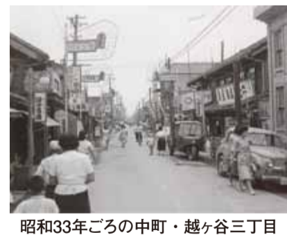
昭和33年ごろの中町・越ヶ谷三丁目