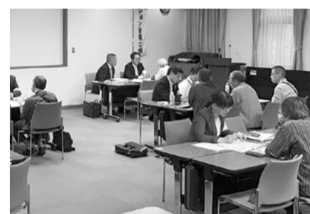
昨年度の相談会の様子

◆全国一斉 法務局休日相談所 10月1日(日)、午前10時~午後3時 国さいたま地方方法務局(さいたま市中央区下落合5の12の1) 国公正証書、土地・建物の相続などの相談 国さいたま地方方法務局総務課 ☎048-851-11000(代表) ◆越谷市マンション管理基礎セミナーおよびマンション管理無料相談会 9月30日(土)、①午後1時~3時45分 ②午後3時40分~4時30分 国中央市民会館5階第4~6会議室 国①マンション管理基礎セミナー「災害時、管理組合」ができること「大規模災害に備える管理規約の見直しはお済みですか」・情報交換会