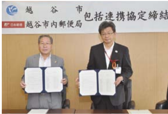
越谷市長と新越谷郵便局長

8月3日、越谷市役所で越谷市と越谷市内郵便局による包括連携協定の締結式が行われました。