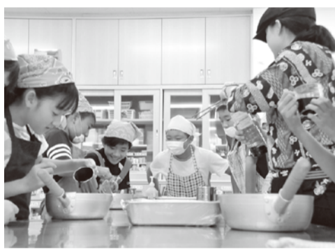
スープもオリジナルブレンドです

8月24日、南越谷地区センター調理室で料理教室が開かれました。講師は元ラーメン屋さんの地区センター職員で、メニューはつけ麺とフ