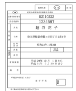
重度心身障害者医療費受給者証

付がスタートしたことに伴い、30年7月で運用を終了します。マイナンバーカードを利用すると、市内だけでなく全国のコンビニエンスストアで住民票の写し等の証明書が取得できます。マイナンバーカードの作成には、申請から受け取りまで1カ月程度かかります。 〈終了日〉 平成30年7月31日 *しがや市民カード(緑色)は証明書自動交付機の運用終了後も印鑑登録証として、窓口で必要となります 市民課 ☎963319126