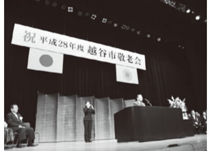
昨年の敬老会の様子

※受け付け時間前に入場はできません ※案内状に記載された時間以外にご来場の場合、入場をお断りすることがあります ※水分補給用の飲み物をお持ちください ※体調が思わしくない場合の参加はご遠慮ください ※当日、来場者に配布していた記念品(菓子・タオル)はありません 〒343-8501 越谷市 越ヶ谷4-2-1 越谷市役所