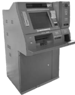
証明書自動交付機

入居しようとする世帯全員の合計所得が月額15万8000円以下(障がいのある方等は月額21万4000円以下)の方 ⑤暴力団員でない方 *シルバーハウジング住宅は別途応募資格あり。詳しくは埼玉県住宅供給公社へ(申込み) 10月1日(日)～21日(日)(消印有効)に郵送で埼玉県住宅供給公社へ。募集案内は市役所総合受付(本庁舎1階)、建築住宅課(本庁舎3階)、北部・南部出張所、各地区センターで配布します 圓埼玉県住宅供給公社 ☎330118516さいたま市浦和区仲町3の12の10 ☎04811829112873(土曜・日曜日、祝日を除く。午前8時30分～午後5時15分)