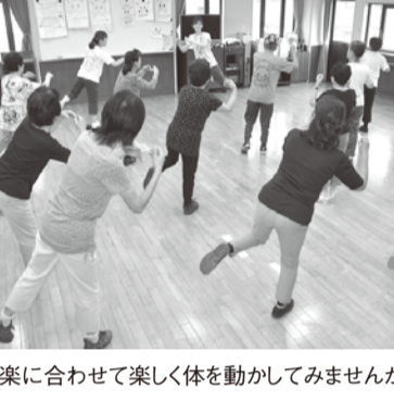
音楽に合わせて楽しく体を動かしてみませんか

◎「コバトンヘルシークッキング」 時間9月28日(木)、午前10時~午後1時 因講話と調理実習 因24人 費500円 申9月11日(月)から