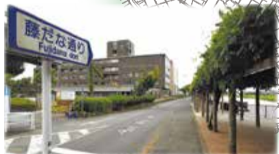
皆さんに愛され親しまれる愛称を

— 市制30周年記念事業により愛称が設定された路線 — 市制60周年記念事業として愛称を募集する路線