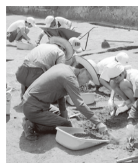
遺跡の発掘調査の様子

方若十名。①市内在住・在勤・在学で16歳以上 ②2日間の文化財ボランティア講座を受講できる 囚8月15日(水)までに電話で左記へ。応募者多数の場合は抽選 囚文化財ボランティア講座:時8月23日(水)・24日(金)、午後1時30分～3時30分(全2回) 囚第二庁舎5階会議室B 囚生涯学習課 ☎963-9331