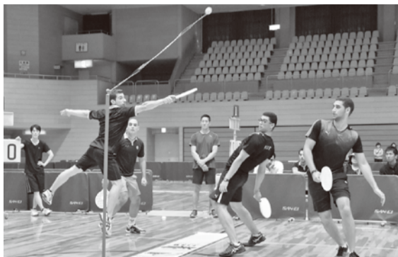
エジプトのクラブ同士による男子ダブルスの決勝戦