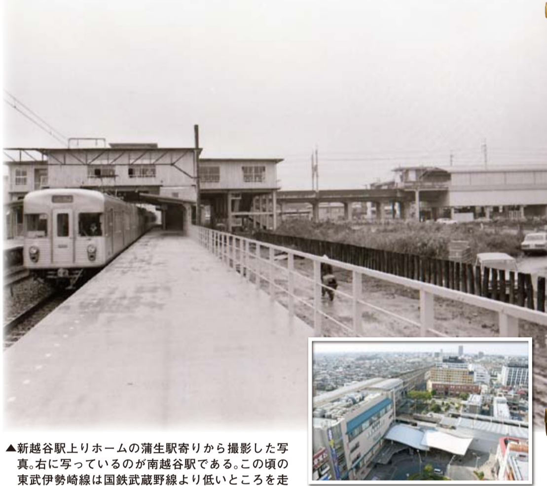
▲新越谷駅上りホームの蒲生駅寄りから撮影した写真。右に写っているのが南越谷駅である。この頃の東武伊勢崎線は国鉄武蔵野線より低いところを走っていた＝昭和49年ごろ

平成13年3月には東京都境から北越谷駅までの約12.5kmの東武伊勢崎線連続立体交差事業が完成した。