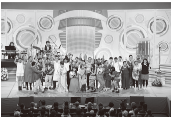
ステージに並ぶ本選出場者20組とゲスト、小田切アナウンサー

本選に出場するのは250組が出場した前日の予選会を勝ち抜いた20組。午後0時15分、おなじみの鐘の音とともに生放送が始まると客席からは割れんばかりの拍手が起きました。