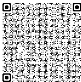
アンケート調査フォーム QR コード

URL : https://forms.office.com/r/epQ1TRdasb