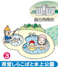
3 県営しらこぼと水上公園