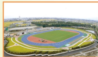
4 しらこぼと運動公園