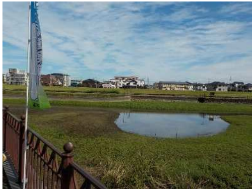
作業後の様子（作業場所①）