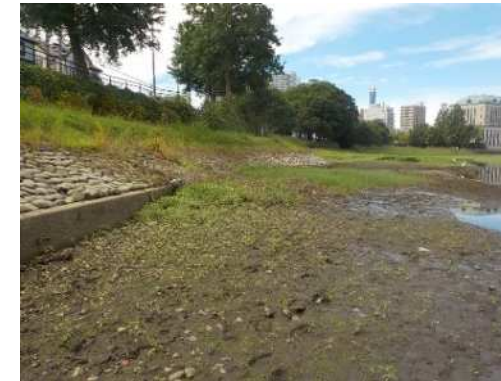
作業後の様子（作業場所②）