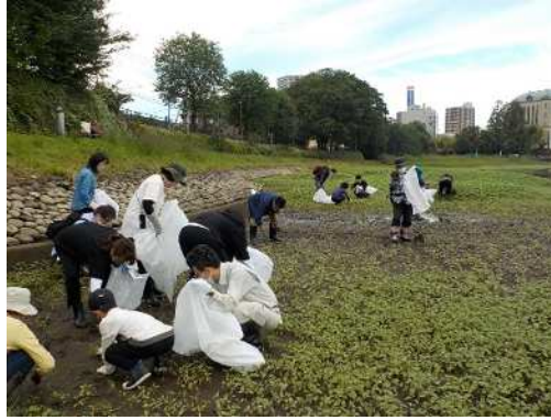
作業中の様子（作業場所②）