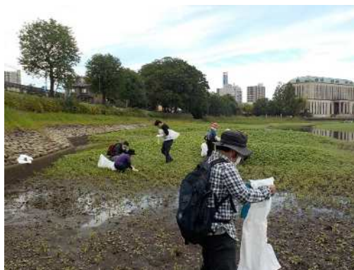
作業中の様子（作業場所②）