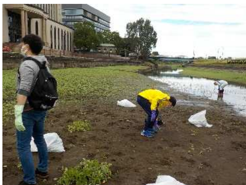
作業中の様子（作業場所①）