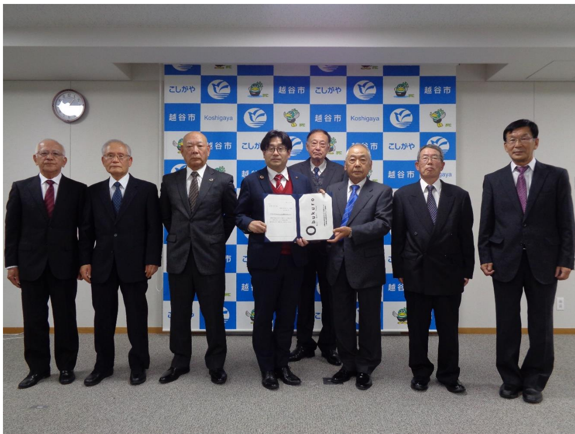
<構想提出時の様子>

大袋駅東口周辺地区まちづくり協議会では、大袋駅東口周辺地区にふさわしいまちづくりについて、検討してきましたが、このたび、これまでの検討内容等を大袋駅東口周辺地区まちづくり構想（以下、まちづくり構想と記載します）としてまとめました。本構想については、令和4年11月22日（火）に越谷市長へ手渡しました。