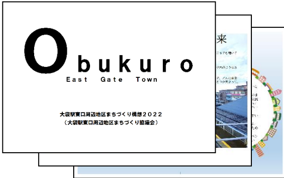
まちづくり構想（本編）