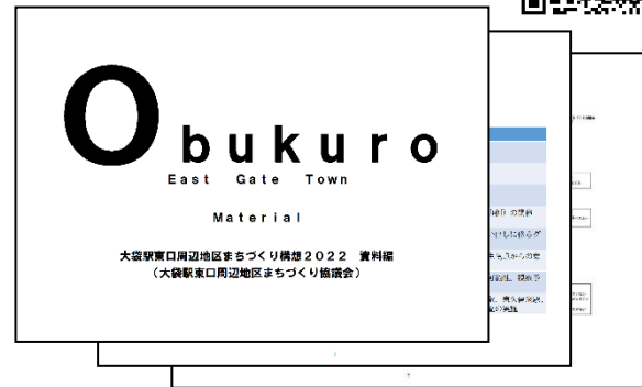
まちづくり構想（資料編）

このたび、地域の想いをまちづくり構想としてまとめることができたのは、皆様のご協力あつてのことです。この場を借りてお礼申し上げます。また、まちづくり構想の提出という大きな節目を迎えましたが、まちづくりの推進には、地域と市を結ぶ組織が必要不可欠です。当協議会については、今後も活動を継続しますので、引き続きご助言、ご協力のほどよろしくお願いいたします。