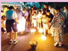
越谷ファミリータウン