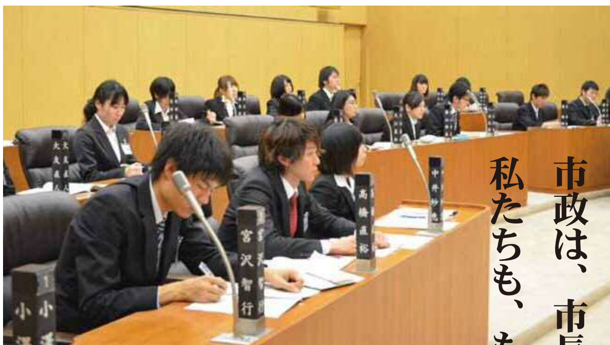
【平成24年度 越谷市学生議会の様子】