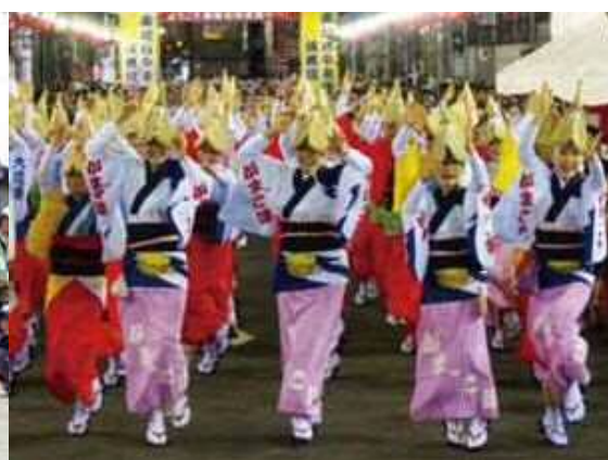
【右】 南越谷駅・新越谷駅周辺で、毎年恒例で開催されている「南越谷阿波踊り」の様子。