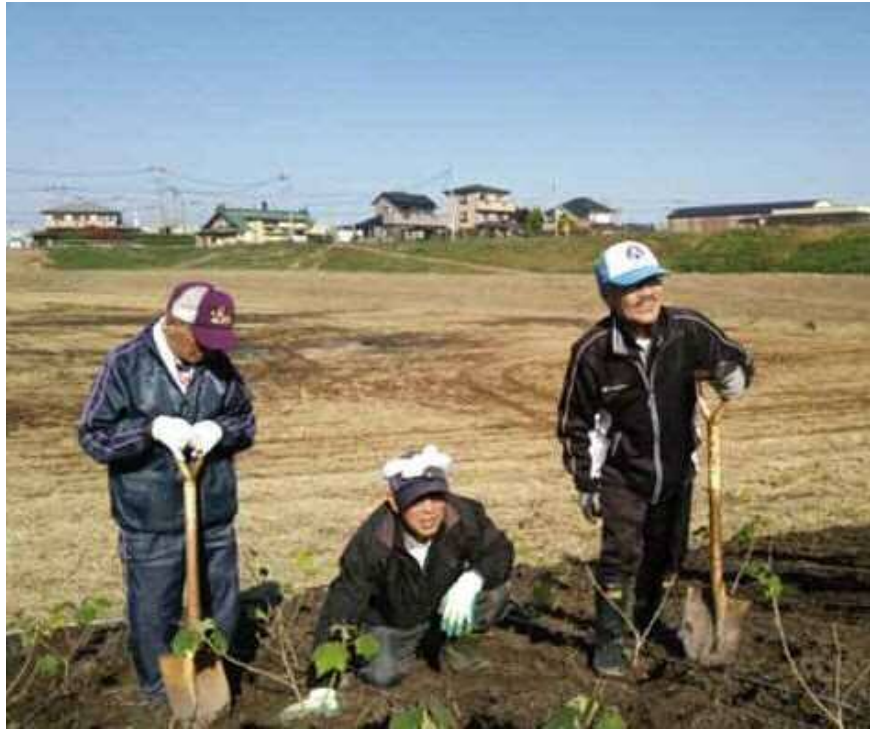
四季の里運営協議会が主催した植樹祭の様子。地域の方々と 東越谷調整池に酔芙蓉 すいふよう 450本を植樹しました。