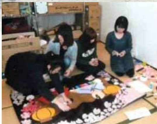
【↑上】季節の絵はハロウィン。 貼り終わってみんな笑顔！