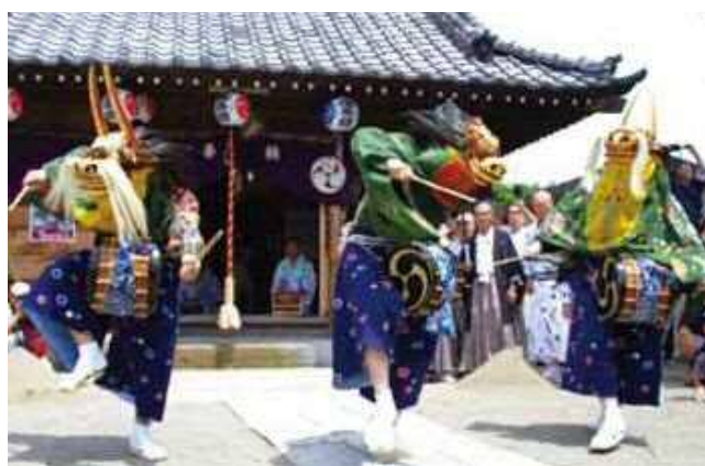
【左】 県指定無形民俗文化財である、「下間久里の獅子舞」の様子。