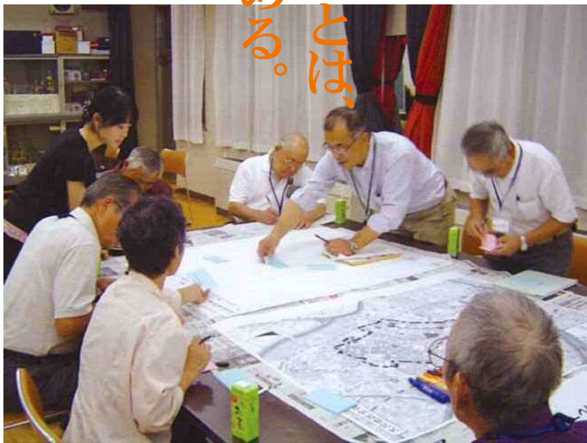
【第4次総合振興計画前期基本計画 地区まちづくり会議の様子】