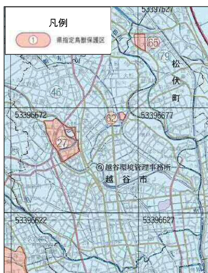
図：令和2年度埼玉県鳥獣保護区等位置図より抜粋