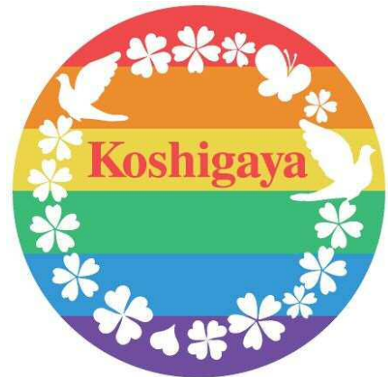
越谷市「啓発ロゴマーク」

この制度は、性的少数者を対象に、宣誓された方が、自分らしく、安心して暮らすことを支援するとともに、性の多様性への理解促進を図り、すべての人が個人として尊重されるよう、多様性を認め合い、だれもが自分らしく生き生きと暮らせる社会の実現を目指すものです。制度概要等、詳しくは下記のとおりです。