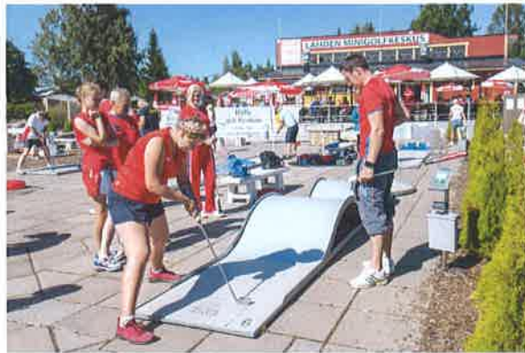
【ミニゴルフ プレーイメージ】