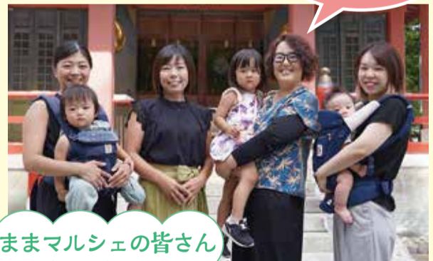
マママルシェの皆さん