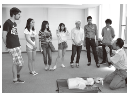
外国人市民のための防災訓練

りたくない! キク姉さん コバトちゃん、良い心がけよ。「多文化共生」の第一歩ね。