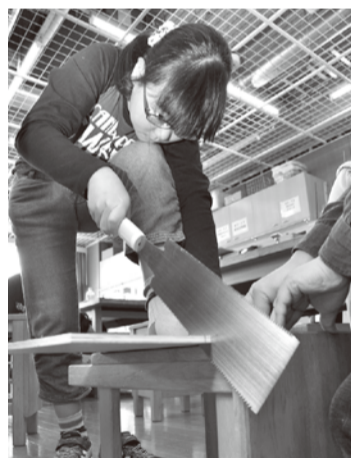
一生懸命のこぎりを使っています

慣れない道具に苦戦しながらも、「のこぎりを使ってまっすぐ切るのは難しいけれど、とても楽しい」と完成を目指して真剣に取り組んでいました。