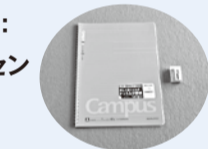
記念品: リングノートと消しゴムのセット