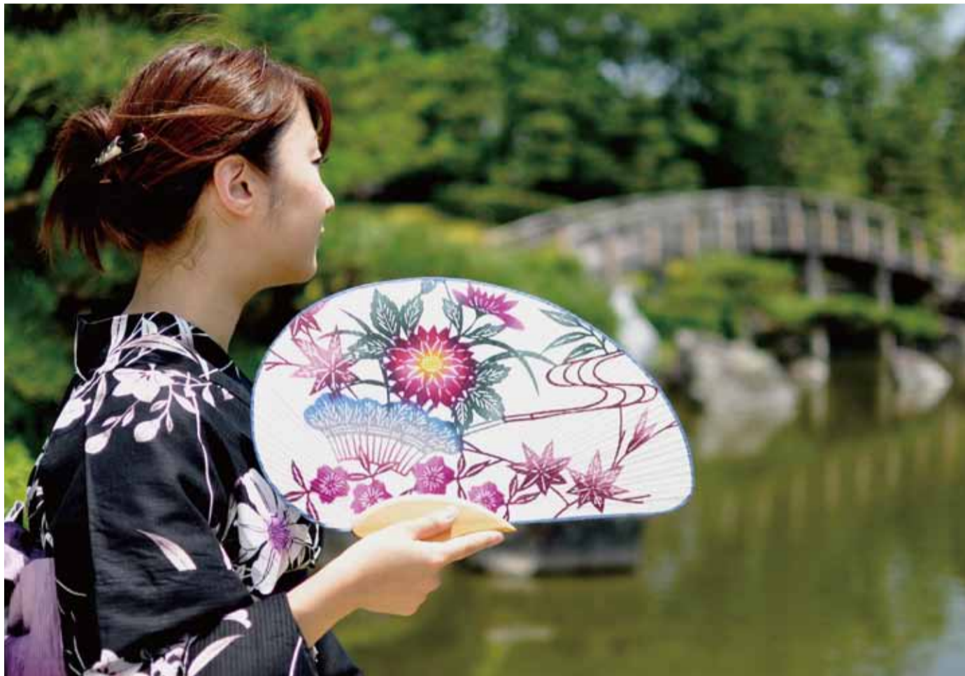
撮影地:日本庭園「花田苑」

発行/越谷市 ☎343-8501 埼玉県越谷市越ヶ谷4-2-1 ☎964-2111(代表) ☎965-6433 www.city.koshigaya.saitama.jp *広報紙は市ホームページからもご覧になれます 編集/広報広聴課