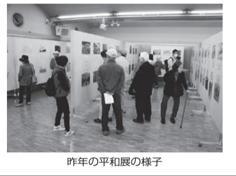
昨年の平和展の様子

件を守り、年間を通して除草等区画管理のできる成人の方(1世帯につき1区画、重複申込み不可)。他の市民農園・いきいき農園利用者とその世帯の方は申込み不可 因7月1日(金)~14日(木)(消印有効)に、往復はがきの往信面に住所・氏名・電話番号・希望農園名、返信面の宛先に郵便番号・住所・氏名を記入し農業振興課へ。電子申請でも申込みできます。応募多数の場合は、7月19日(火)、午後2時から市役所第二庁舎5階会議室Aで公開抽選を行います。結果は応募者全員に通知します。区画の指定はでき