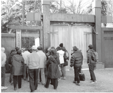
立派な埼玉鴨場の門

コバトちゃん キク姉さん、今日はどこに連れて行ってくれるの？ キク姉さん コバトちゃん、コバトちゃん、着いたわ。ここが入り口よ。 コバトちゃん すごい門だね！