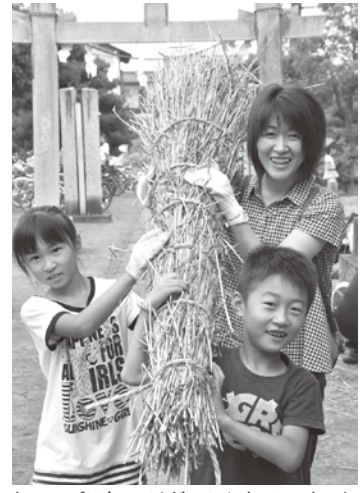
ちよっぴり細いけど、みんなで作った初めての松明だよ

7月2日、川崎神社で、新方小学校や地元自治会などの親子約70人が集まり、「北川崎の虫追い」で使用する松明を作る講習会が開かれました。虫追いは、稲の害虫を麦わらで作った松明で追い払い、豊作を祈る行事で、埼玉県の文化財に指定されています。