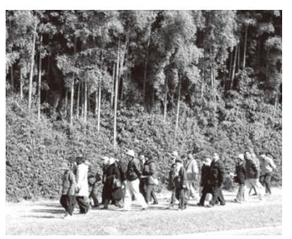
鴨場の中を歩く見学会の参加者

ね。ところで、どうして越谷市に鴨場があるの？ キク姉さん もともと越谷には、江戸幕府の鷹場があったの。鷹場は、鷹を使った猟が行われる場所のことよ。明治時代には皇室専用の御鷹場として指定されていたの。その後、東京都の浜離宮に飛来する鴨が少なくなったので、明治41年に越谷に埼玉鴨場が設けられたのよ。 コバトちゃん 今日は特別に埼玉鴨場に入らせてもらったけれど、ふだんは入れない場所なんだよね。 キク姉さん そうなの。見学会など、限られた日しか入ること