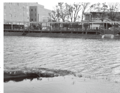
この光景が9月ごろまで見られます

は歩けない葛西用水の川底近くを歩けるのが特別な気分がしておもしろいよ。そうだ、今からみんなで飛び石を渡りに行こうよ！