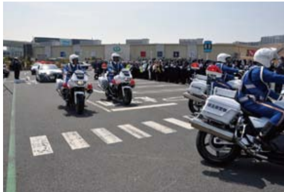
パトロールに出発する白バイとパトカー

最後には、交通安全関係団体の参加者が、会場を訪れた方に啓発品などを配りながら交通安全を呼びかけました。