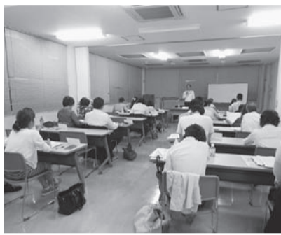
創業を目指す皆さんを応援します

①事業を営むための創業準備金の2分の1以内(女性または満40歳未満の方は上限30万円、そのほかの方は上限20万円) ②貸室に係る月額賃料の2分の