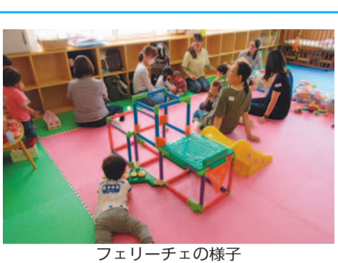
フェリーチェの様子

協働の担い手たち 49 NPO法人 子育てサポーター・チャオ 「NPO法人子育てサポーター・チャオ」は、子どものいる毎日の暮らしを楽しむこと