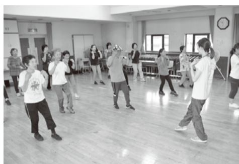
楽しく運動できます

㊦6月19日(月)・7月31日(月) いずれも午前10時〜正午(全3回) ㊦ロコモティブシンドロームについての講義、ロコモ予防のための体操、ミニ体力測定 ㊦市内在住の40歳以上の方各20人 ㊦運動のできる服装、水分補給用の飲み物、筆記用具、電卓、タオル ㊦受付中