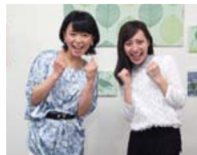
キヤスターとリポーターが変わりました