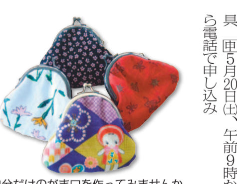
自分だけのがま口を作ってみませんか

子育てサポーター・チャオ 「NPO法人子育てサポーター・チャオ」は、子どものいる毎日の暮らしを楽しむこと