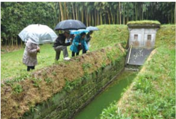
興味深く埼玉鴨場を見学していました