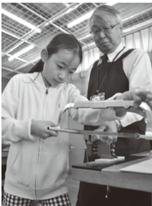
初めての月のこぎりにおっかなびっぴり

4月16日、科学技術体験センター「ミラクル」でウィンドチャイム作りが行われました。この講座は、これからの暑い季節にぴったりなオリジナルのウィンドチャイムを作ってもらおうと企画されたものです。ウィンドチャイムとは、長さを変えてカットしたアルミパイプを糸で吊り下げたもので、風で揺れてぶつくと風鈴のような音色を奏でます。小学4〜6年生10人が参加し、初めに先生から弓のこぎりの使い方を教わり、各自アルミパイプの切断に悪戦苦闘しながら音階に合わせて弓のこぎりで作業を行いました。参加した子どもたちは、自分の作ったウィンドチャイムの音色を聞き、「自分で作ったとは思えないほどきれいで涼やかな音で、今から夏が楽しみですよ」と笑顔で話していました。