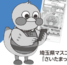
埼玉県マスコット 「さいたまっち」

埼玉県コバトン健康マイレージとは、歩数計を使ったウォーキングを通してポイントを貯めることで、楽しく健康づくりを進めていただくサービスです。