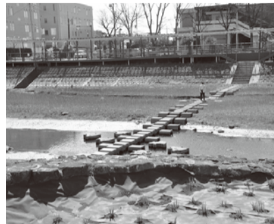
通水前の葛西用水の様子

キク姉さん 満開だった桜もすっかり葉桜になって、緑がすてきな季節になってきたわね。コバトちゃん 風も暖かくなってお散歩するには気持ちいい季節よね。4月にはコブちゃんと一緒に葛西用水の中土手にチューリップを見に行ったのよ。とってもきれいで見とれちゃった。