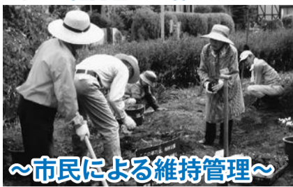
～市民による維持管理～

市では協働のまちづくりを推進しています。安全で快適に利用できる公園の環境づくりを目的に、市内の公園を維持管理していただける団体を募集します