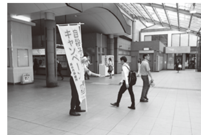
9月10日に行われた自殺予防普及駅頭キャンペーンの様子