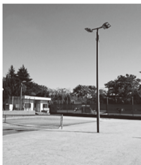
改修した夜間照明