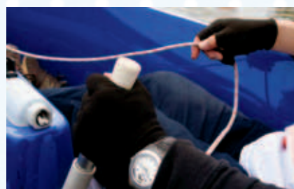
ハンザディンギーを操作する様子写真のように、進行方向を変えるレバーと帆に繋がっている紐を操作してボートを動かします。

『ディンギーパーク』では、ハンザディンギーをはじめ、カヌー、カヤックに乗り、湖面を楽しむ水上アクティビティが手軽に体験できます。なかでもハンザディンギーは、転覆しないように設計された小型ヨットで、子どもから高齢に体験できます。