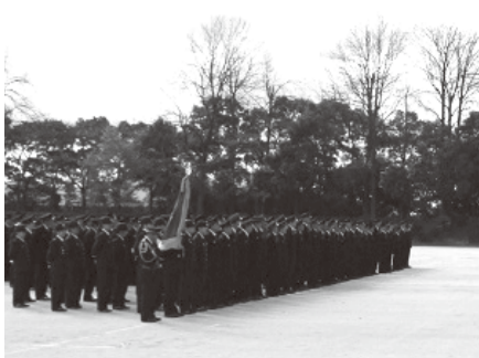
服装点検で整列する消防職員

11月11日(日)、午前9時から 團総合公園多目的運動場。荒天 およびグラウンド不良の場合は、 増林地区センター(関係者の み) 消防職員および消防団 員の人員・服装の点検、車両パ レード、消防自動車からの放水 *一般の見学席もあります 團消防本部警防課 ☎974-1104