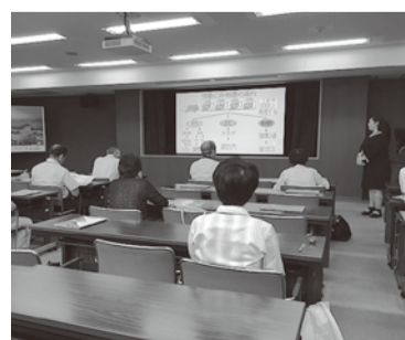
施設見学会の様子

でしたが、知らないことがたくさんあったと驚いた。いきいき越谷はモニターになって見るようになったが、市の広報番組がこんなに面白いとは思わなかった。意見を送ると、そのつど、丁寧な回答がもたらされた。モニターをやったことで意識が高まり、勉強になった。圃広報広聴課 ☎963-9117、FAX ☎965-0943、E-mail: koho@city.koshigaya.lg.jp