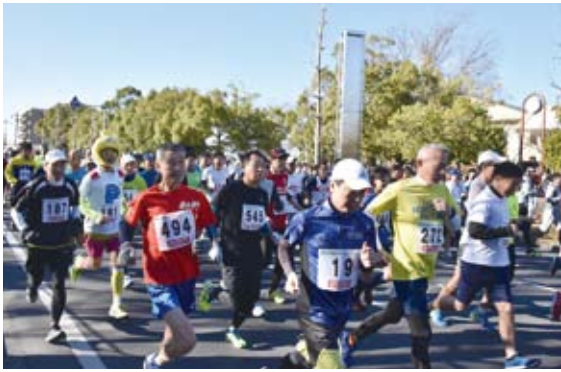
平成最後の元旦マラソン出走！

今年のは幼児から大人まで1724人が参加。用意された各コースを、自己記録を目指す人、楽しくジョギングをする人など、それぞれの目標に向かって爽やかに走り出しました。