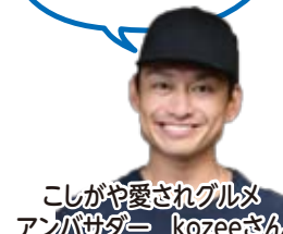
こしがや愛されグルメアンバサダー kozeeさん