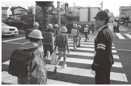
子どもたちの笑顔と安全を見守ります

〈申込み〉 3月14日(木)までに、写真を貼った市販の履歴書を直接くらし安心課へ(土曜・日曜を除く。午前8時30分～午後5時15分)。3月18日(月)に面接による選考を行います