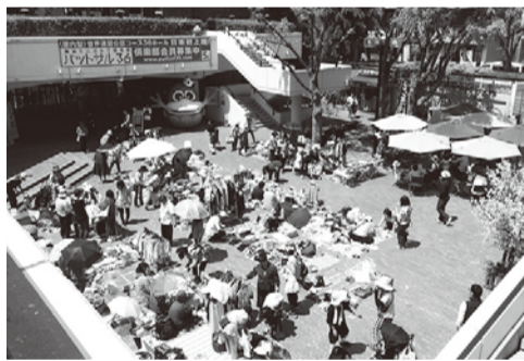
気軽に来店してみませんか

◆越谷市医師会の臨時職員 6月5日～10月下旬、午前10時～午後3時30分 市内在住で次の①または②のいずれかに該当する方。①看護師・准看護師の免許取得者で採血の経験がある ②臨床検査技師の免許取得者で尿検査・心電図検査等の経験がある 市内販の履歴書に資格がある 市内販の履歴書に資格がある 市内販の履歴書に資格がある 免状の写しを添えて直接または郵送で下記へ 問(一社)越谷市医師会 ☎343-0022 東大沢1の12の1保健センター3階 ☎975-6008