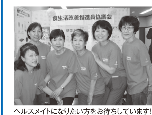
ヘルスマイトになりたい方をお待ちしています!

新規会員の声 ・自己流だった料理も、仲間と勉強し合い、今ではおいしく健康的な食事が作れるようになりました ・塩分やカロリーの勉強をしていくうちに、私生活でも減塩やカロリーダウンの工夫をするようになりました 食生活改善推進員になるためには いつでも、どなたでも入会できます。入会後は会員どうしの研修のほか、ヘルスマイト養成講座である「市民健康教室」で基礎知識を学習しますので資格等は必要ありません。お気軽にお問い合わせください。 1 囚市民健康課☎978-3550