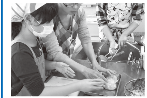
みんなで作る料理は楽しいね!

～越谷市食生活改善推進員を紹介します～ 食生活は健康づくりの基本です。皆さんも私たちと一緒に、地域の健康づくりや食育に取り組んでみませんか。 食生活改善推進員とは 地域の皆さんと共に、食生活を通じて元気で活力ある健康なまちづくりを推進していくボランティアです。全国に協議会組織を持ち、「ヘルスマイト」の愛称で活動しています。「私たちの健康は私たちの手で」をスローガンに、会員どうしの研修や学習会で得た知識や技術を、料理教室