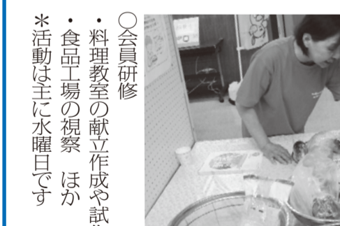
一日に必要な野菜の量は何gかな?