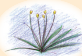
コシガヤ ホシクサ