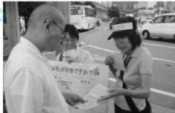
駅前(北越谷駅)でのPR活動。ちらしの配布やアンケートなどを行いました(20年9月)