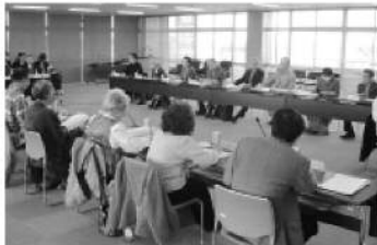
最後の開催となった第9回自治基本条例審議会(全大会)の様子(21年3月)