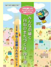
▲越谷市自治基本条例 普及・啓発冊子

作成したパネルは、本庁舎1階ロビーで展示したほか協働フェスタなどでも展示を行いました。