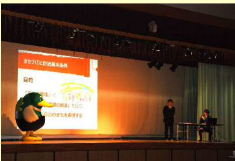
▲高校での講演の様子