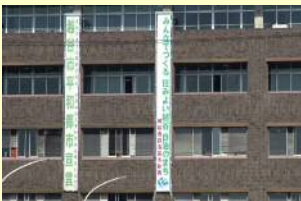
▲自治基本条例懸垂幕（右側）

自治基本条例のキャッチフレーズの懸垂幕「みんなでつくる 住みよい越谷 自治のまち」を市役所本庁舎の壁面に掲示しています。