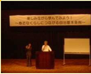
▲シンポジウムの様子