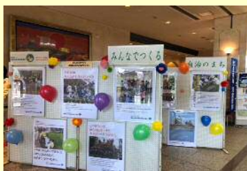
▲協働フェスタでの展示