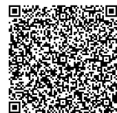
越谷市自治基本条例推進会議 (越谷市ホームページ)