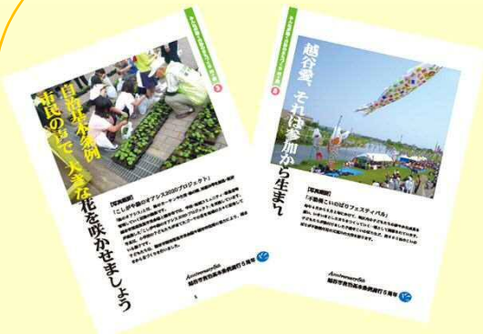
▲越谷市自治基本条例 PRパネル

日常のなかにある、まちづくりや参加の様子についてキャッチコピーや写真を募集し、30枚の PRパネル を作成しました。