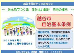
▲本庁舎等モニターでの放映

自治基本条例のキャッチフレーズの懸垂幕「みんなでつくる 住みよい越谷 自治のまち」を市役所本庁舎の壁面に掲示しています。