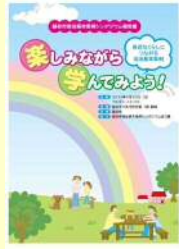
▲シンポジウム報告書

シンポジウム 「楽しみながら学んでみよう！」 ～身近な暮らしにつながる自治基本条例～