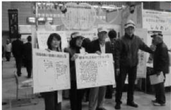
こしがや産業フェスタにブースを出展。アンケートを行うなど自治基本条例のPRを行いました(20年11月)