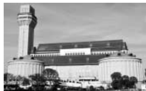
県南東部の5市1町の燃えるごみを焼却処理している東埼玉資源環境組合第一工場

放射性物質の影響で、東埼玉資源環境組合第一工場で焼却処理をした燃えるごみの最終処分が困難な状況になっています。焼却処理の際に発生する飛灰(焼却時の排ガスに含まれるばいじん)の受け入れを、秋田県内の最終処分場が停止しているためです。