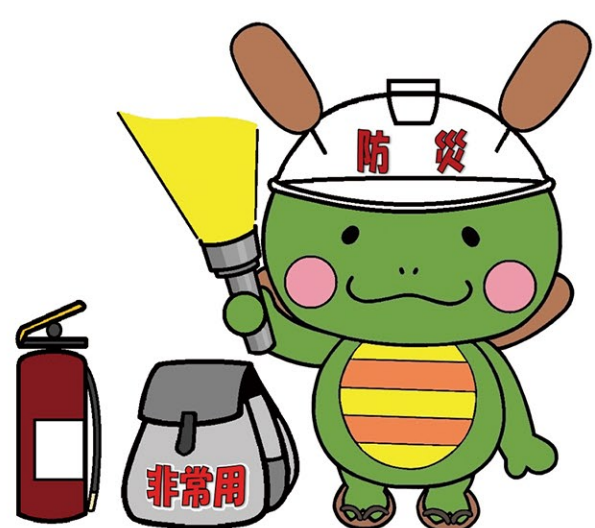
蒲生地区マスコットキャラクター「かもびー」