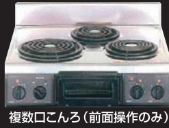
複数口こんろ (前面操作のみ)