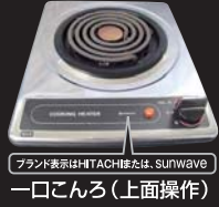
ブランド表示はHITACHIまたは、SUNWAVE 一口こんろ (上面操作)