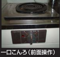
一口こんろ (前面操作)